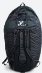
Sac rapide speedriding